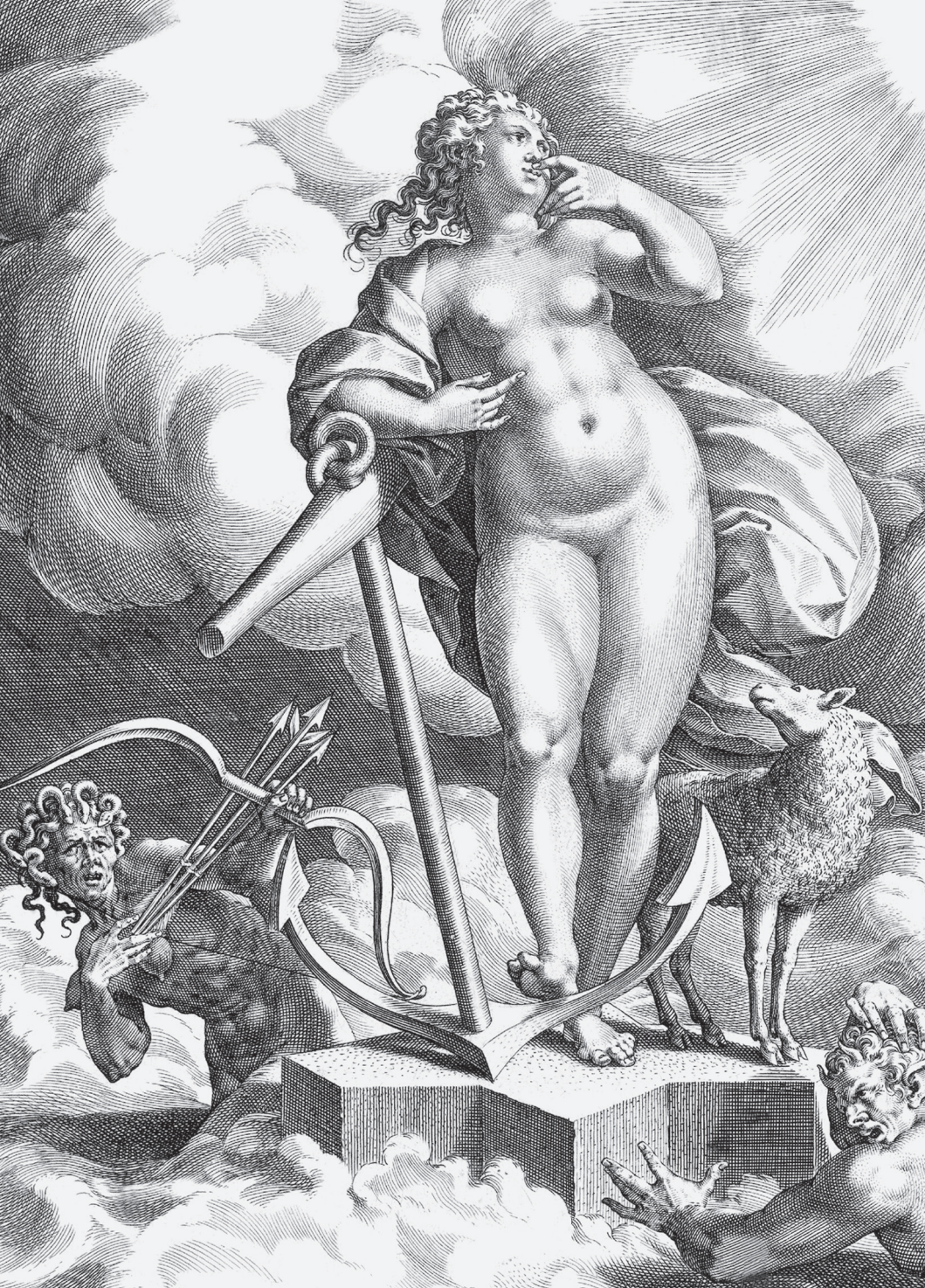
I. Sadeler sculpt: excudit.